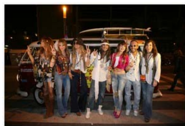
Pulse las fotos para Ampliarlas

VIII convocatoria de premios, iecas y ayuda a la investigación